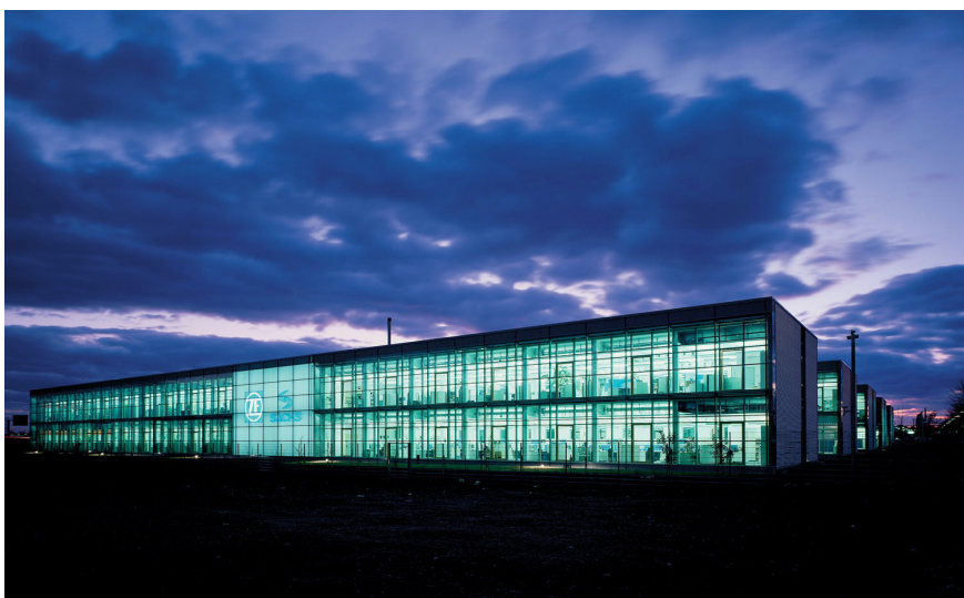
ZF Friedrichshafen AG Hauptgeschäftsstelle in Friedrichshafen

Der ZF Maschinenbau ist strategischer Partner aller Divisionen der ZF und entwickelt, baut und liefert Sondermaschinen für die interne Verwendung. Damit leisten wir einen entscheidenden Beitrag zur Prozessentwicklung und Industrialisierung von diversen, innovativen Produkten der ZF. Pro Jahr erstellen wir rund 900 Angebote für Ersatzteile, Werkzeuge und Sondermaschinenentwicklungen. Somit kommen jährlich ca. 70 Projekte für Sondermaschinen bei ZF Maschinenbau zustande. Diese haben ganz unterschiedlichen Umfang, typischerweise liegt die Laufzeit zwischen 9 und 14 Monaten. Alle Projekte werden bereichsübergreifend durchgeführt, unsere Kunden kommen stets aus anderen Divisionen und von weltweiten