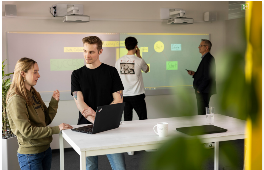
Die Weiterentwicklung von BCS ermöglicht auch mit wachsender Mitarbeiterzahl eine zukünftige Nutzung der Software.

Fortlaufend entdecken wir neue Funktionen und Möglichkeiten, die uns unsere Arbeit im Controlling – und Finance-Bereich effektiver und effizienter gestalten lassen.