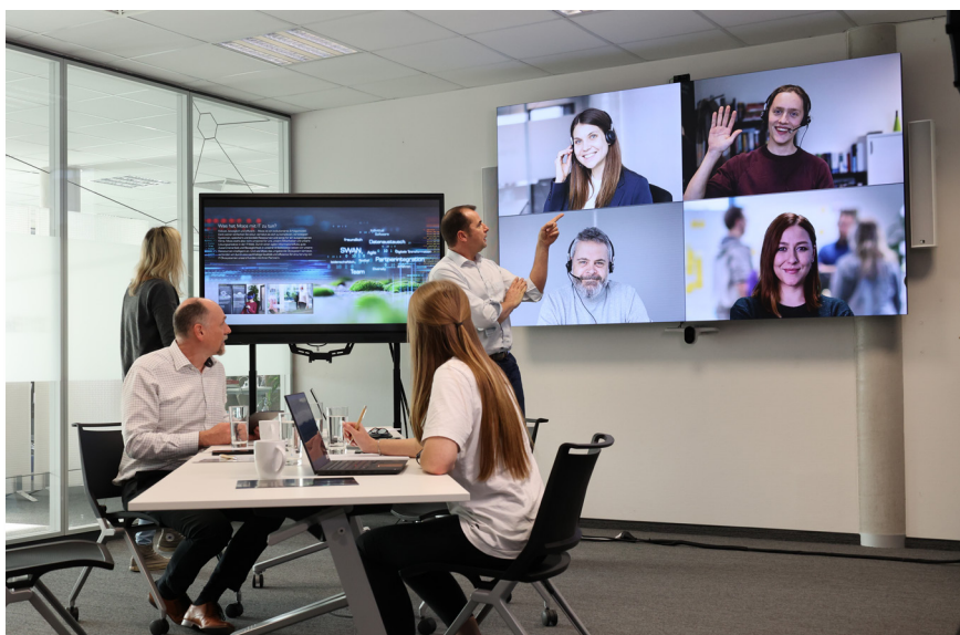
Integration, Agilität und Vernetzung spielen sowohl in der Zusammenarbeit zwischen den Mitarbeitenden und in der Zusammenarbeit mit Kunden eine zentrale Rolle. (Grafik: SSC-Services)

Gestartet sind wir am 1. Januar 2014 mit den grundlegenden Funktionen Zeiterfassung, Urlaubsplanung, Projektbuchungen und Projektcontrolling. Ein großer Schritt für uns alle, der unseren Workflow deutlich optimiert und uns ein Projektcontrolling ermöglicht hat.