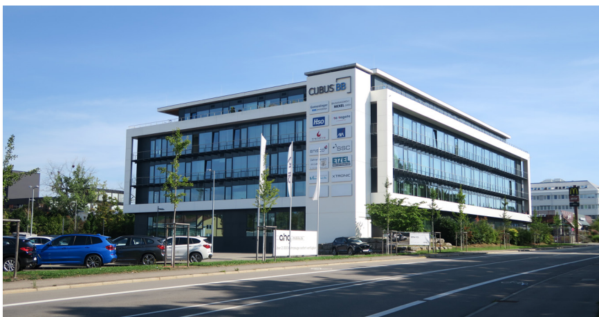
Die SSC-Services GmbH mit Sitz in Böblingen ist ein IT-Dienstleister mit 200 Mitarbeitenden.

Als mittelständisches Unternehmen legen wir besonders großen Wert auf einen persönlichen, freundlichen und fairen Umgang mit unseren Kunden. Die Themen Integration, Agilität und Vernetzung spielen sowohl in der Zusammenarbeit zwischen den Mitarbeitenden als auch in der Zusammenarbeit mit unseren Kunden eine zentrale Rolle.