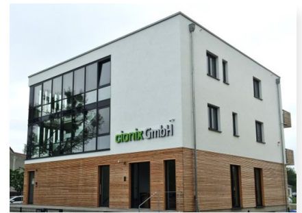
Unser Firmensitz in Falkensee.

weshalb sind wir seit 2020 nach ISO 27001:2013 zertifiziert sind.