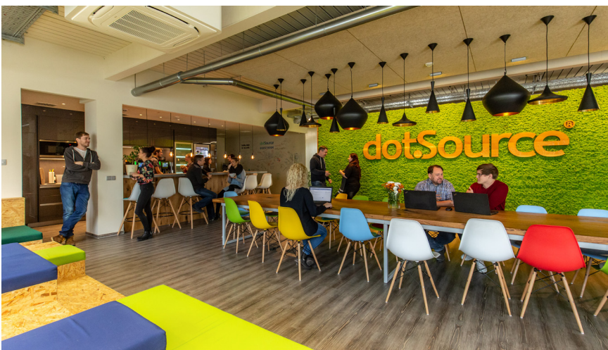
dotSource ist eine Digitalagentur in Jena.